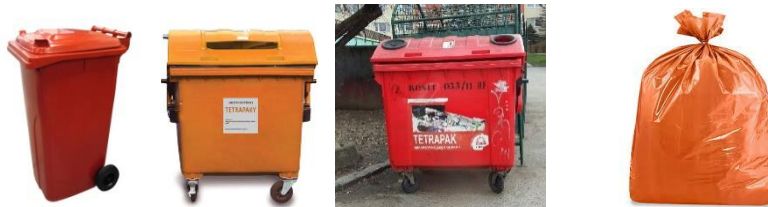
Obr. 5: Zberná nádoba – zvyčajne oranžová, niekde ešte aj červená

Zbiera sa: kartóny z nápojov, vypláchnuté všetky krabice od džúsu, mlieka, vína, kefiru, smotany, šľahačky a iné s označením C/PAP. Nápojové kartóny je potrebné vypláchnuť malým množstvom vody, rozložiť rohy a stlačiť.