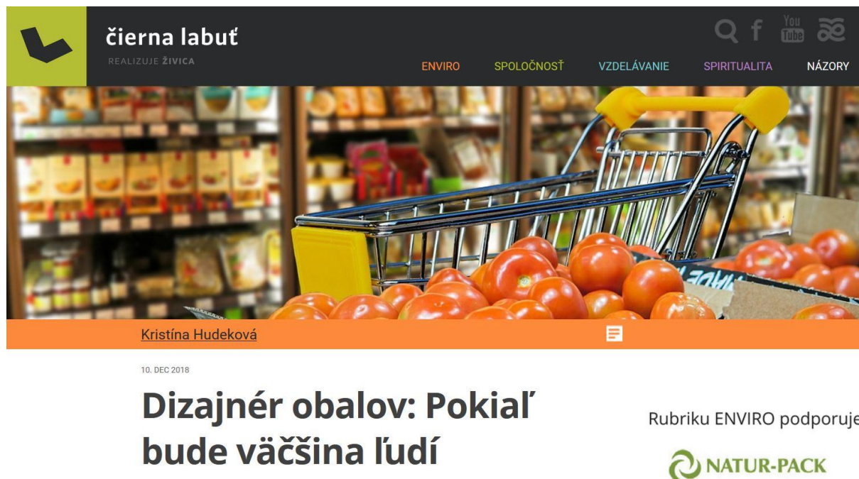
Obr. 22: Vizuál úvodu reportáže o dizajne obalov na portáli Čierna labuť