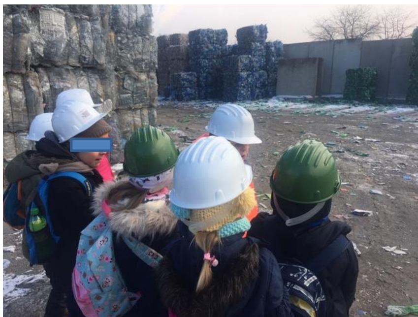
Obr. 13: Ekovýchova v areáli spaľovne zberovej spoločnosti KOSIT

https://www.kosit.sk/skoly-a-osveta/centrum-environmentalnej-vychovy/