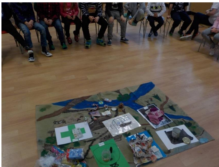
Obr. 11: Zážitková ekovýchova DAPHNE, 19. 11. 2018, MŠ Gessayova