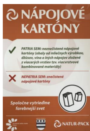
Obr. 6: Ukážka nálepky na zbernú nádobu pre VKM