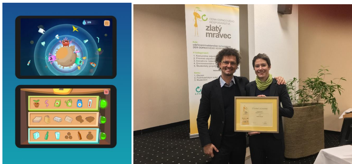
Obr. 21: Vizuál hry Garbage Gobblers a prevzatie ocenenia v rámci Dňa odpadového hospodárstva 2018