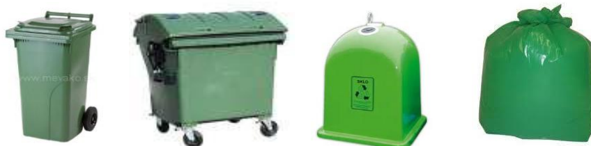
Obr. 7: zberná nádoba – zelená

Zbiera sa: prázdne sklenené poháre od zaváranín a sklené fľaše od nápojov. Možnosti zberu sú buď bez farebného rozlíšenia ako sklo zmiešané, alebo ako sklo roztriedené na číre sklo a sklo farebné.