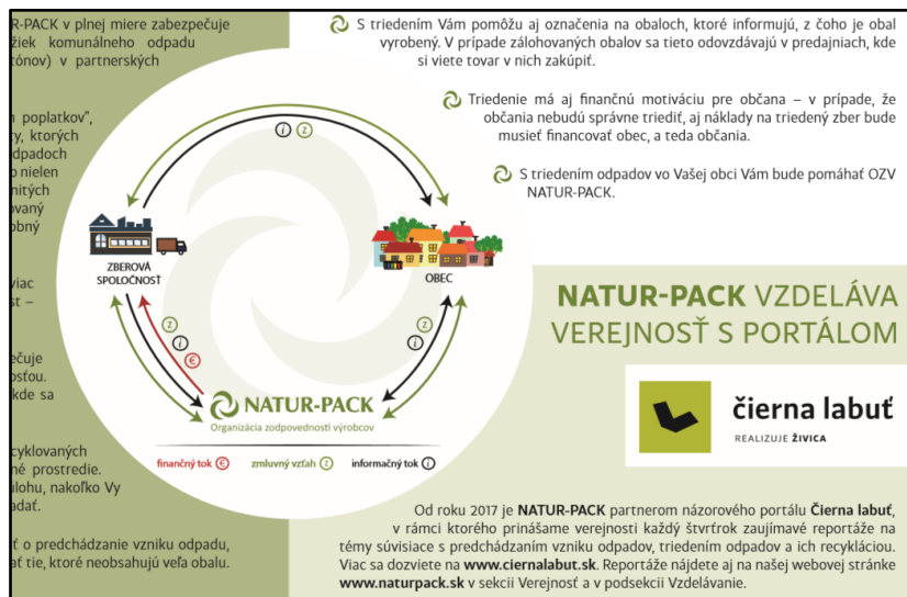
Obr. 17: Časť vizuálu textovej časti letáka do domácností v partnerských samosprávach NATUR-PACKu