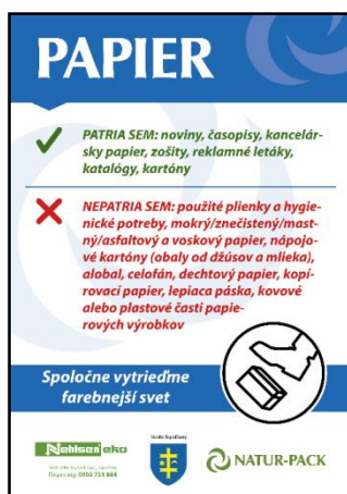
Obr. 2: Ukážka nálepky na zbernú nádobu pre papier

V nádobách/vreciach určených na zber papiera sa spolu zbierajú odpady z obalov (zvyčajne kartónové krabice, papierové obaly) a odpady z neobalových výrobkov (noviny, letáky, časopisy). Zberné nádoby sú opatrené názvom, obrázkom zbieranej komodity a zvyčajne nálepka obsahuje aj stručný popis, čo do daného kontajnera patrí, prípadne nepatrí. Veľkoobjemové kontajnery sa využívajú na zber v zberných dvoroch a sú označené príslušnou komoditou.