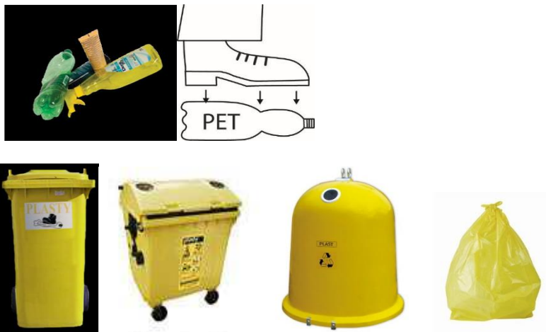
Obr. 3: Zberná nádoba – žltá

Zbiera sa: PET fľaše z nealkoholických nápojov, plastové fľaše od octu, vína, drogérie, nápojové obaly v stlačenej forme, sáčky, fólie, igelity.