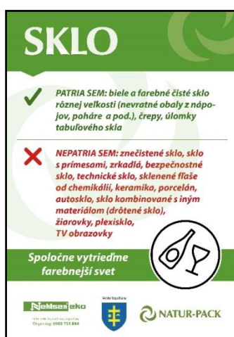
Obr. 8: Ukážka nálepky na zbernú nádobu pre sklo