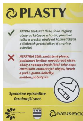
Obr. 4: Ukážka nálepky na zbernú nádobu pre plasty

V nádobách/vreciach určených na zber plastov sa spolu zbierajú odpady z obalov (najčastejšie PET fľaše, obaly z „drogérie“ a potravín, vrecúška, fólie atď.), ktoré tvoria podstatnú časť triedených plastov, a odpady z neobalových výrobkov. Zberné nádoby sú opatrené názvom, obrázkom zbieranej komodity a zvyčajne nálepka obsahuje aj stručný popis, čo do daného kontajnera patrí, prípadne nepatrí. V niektorých lokalitách je zavedený osobitný zber PET fliaš a ostatných druhov plastov. Veľkoobjemové kontajnery sa využívajú na zber v zberných dvoroch a sú označené príslušnou komoditou.