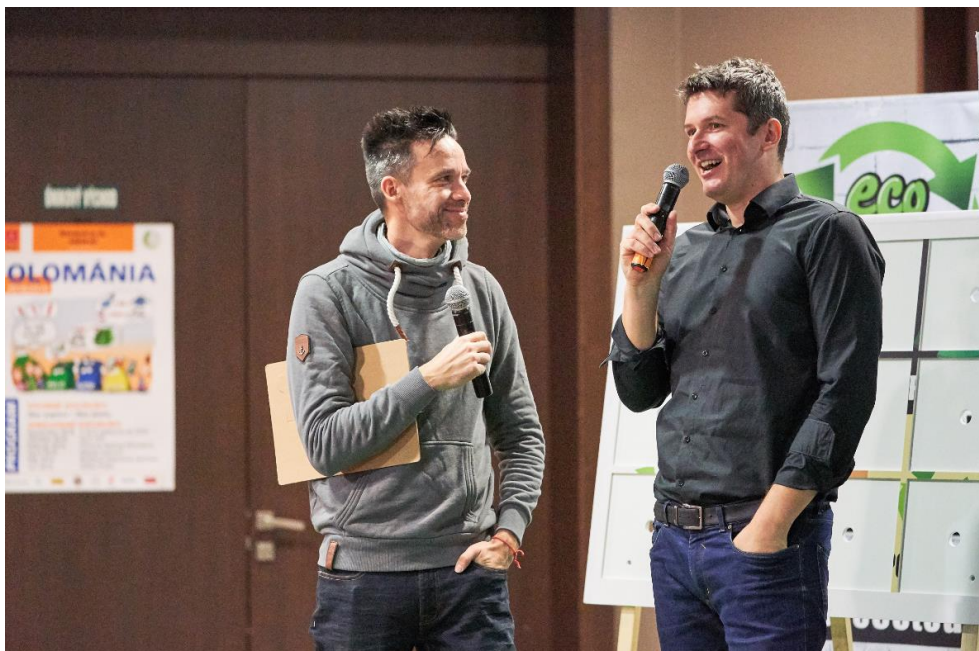
Obr. 12: NATUR-PACK je aktívnym partnerom podujatí v rámci projektu OLOMÁNIA

https://www.olomania.sk/na-olo-art-prisiel-aj-sagan/ , https://bit.ly/2FOckLy a www.olomania.sk