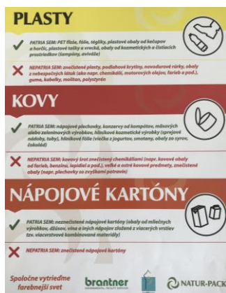
Obr. 10: Ukážka nálepky na zbernú nádobu pre kombinovaný zber

V praxi sú zavedené systémy zberu, kde sú jednotlivé komodity zbierané do spoločnej nádoby/vreca. Jedná sa o zber plastov, kovov a viacvrstvových kombinovaných materiálov v ich ľubovoľnej kombinácií. Podmienkou efektívnosti takého spôsobu zberu je, aby nedošlo k znehodnoteniu kombinovane zbieraných komodít, najmä aby bolo zabezpečené bezproblémové následné dotriedenie a zabezpečenie maximálneho zhodnotenia.