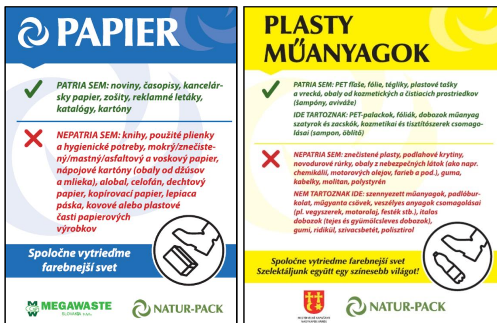
Obr. 18: Ukážka vizuálu nálepiek – príklad nálepiek pre zberovú spoločnosť Megawaste a pre mesto Veľké Kapušany

V predmetnom období sme zabezpečovali distribúciu nálepiek (komodity SKLO, PLASTY, PAPIER, VKM a KOVY) pre zberovú spoločnosť Megawaste , mesto Krásno nad Kysucou a mesto Veľké Kapušany . V prípade mesta Veľké Kapušany boli vytvorené dvojjazyčné verzie nálepiek (SK, HU). Distribúciu týchto nálepiek sme vykonali v priebehu októbra 2018. V predmetnom období sme začali zabezpečovať nové požiadavky partnerských samospráv (mesto Hlohovec , Stará Ľubovňa ).