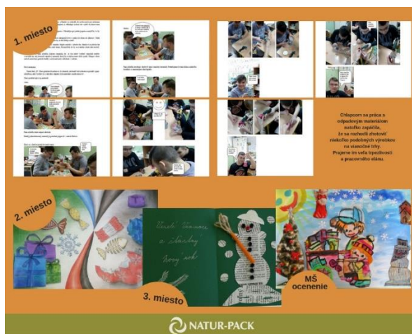
Obr. 19: Vizuál vyhodnotenia kreatívnej súťaže pre partnerské samosprávy NATUR-PACKu

https://bit.ly/2FFVtjz , https://is.gd/zNOItF , http://bit.ly/2pdvNjw